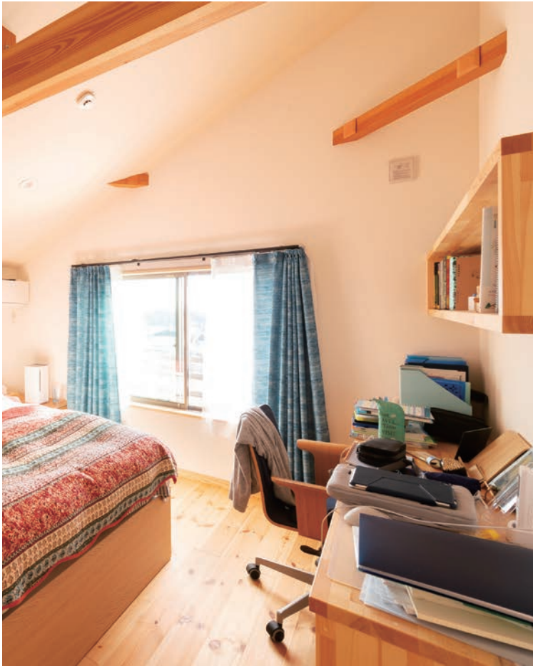
勾配天井の個室、棚も机も当社の造作です。