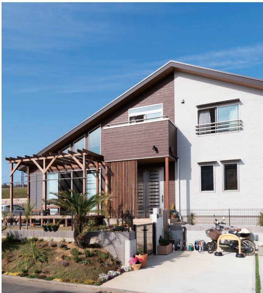
海に面する陽当たりの良い家。ロケーションを活かす為の大開口とウッドデッキ、そして南国風の庭。

今回のT様はもともと逗子海岸から ほど近い場所に住まわれていましたが、今 回佐島の海が見える土地を購入され斎 藤工務店で新築されました。 開放的な吹き抜けのあるリビングから つづくウッドデッキ、心地よい風を受けな がら庭越しに見える海が最高です。 陽当たりも良くするために南面には大 きなサッシと、吹き抜けには高窓もたく さん配置しました。