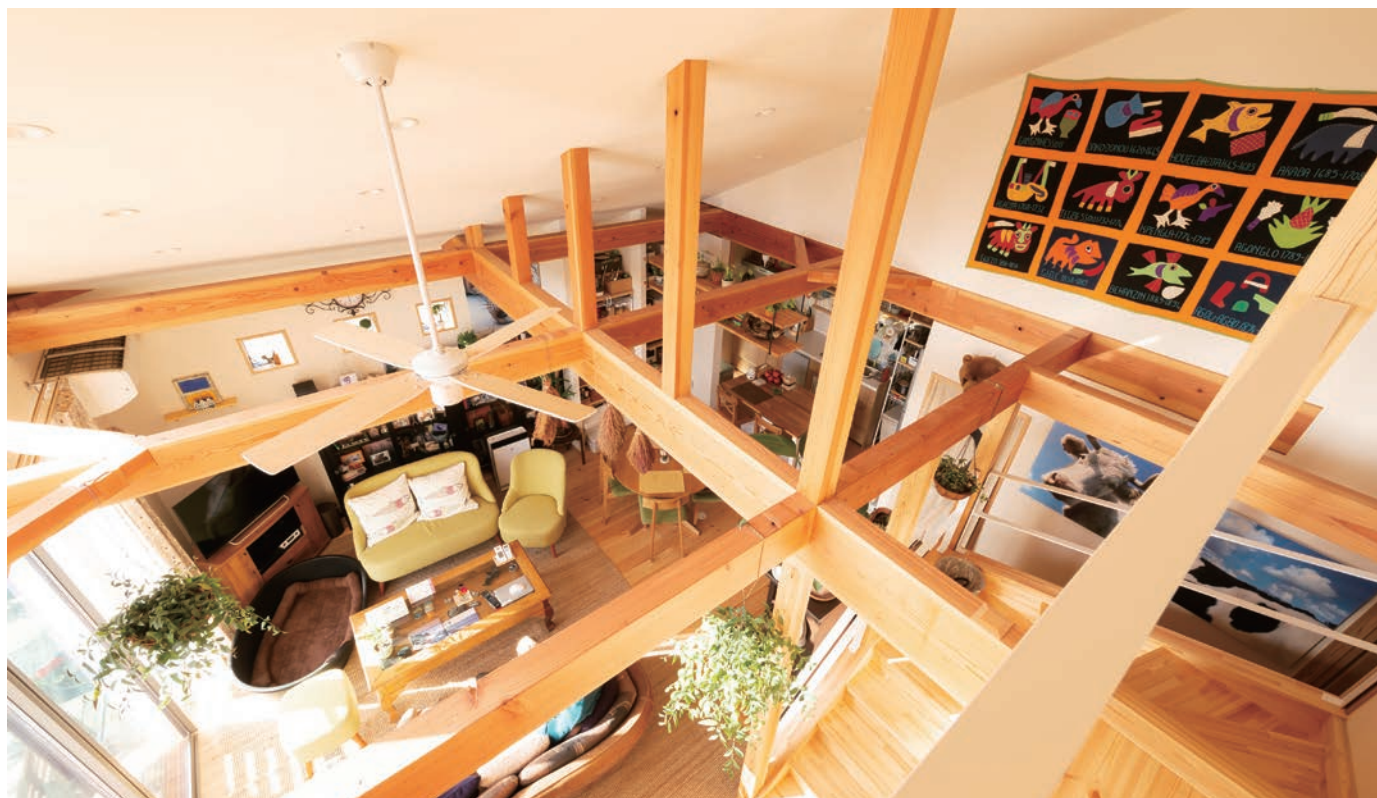
2階ホールからリビングを見渡せる吹き抜け、吹き抜けの壁にもタペストリなどをセンス良く配置されています。