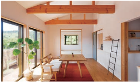
ファミリーリビングは梁を出し、より広がりのある空間に。