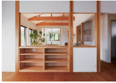
開放感が有りつつも、充実した収納スペースを確保。