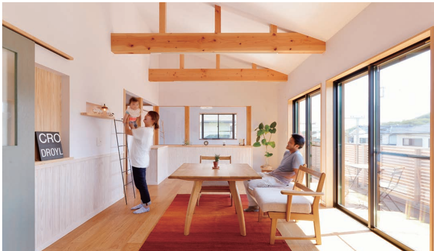
今回のリフォームのメインは2階。イメージは、カリフォルニアスタイル。ご主人様と奥様のお好きなテイストに合わせてのプランニング。