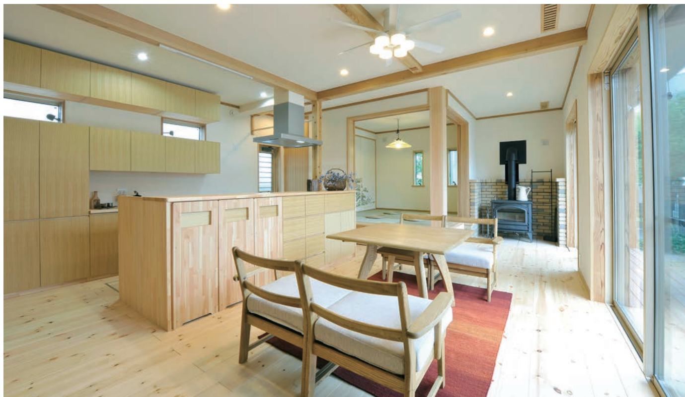
蔦ストーブによって部屋を区切る必要がなくなり、LDKはもちろん和室の小上がりも含め家族で空間を共有、自然と会話が生まれます。