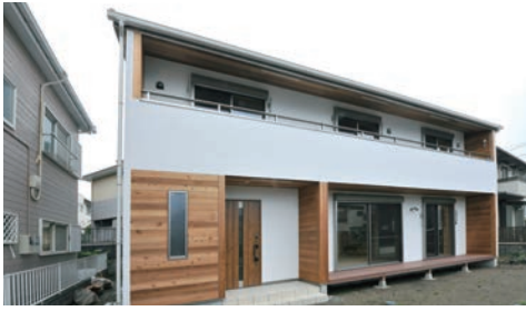
玄関、軒天井のレッドシダーがアクセントになっている白基調の美しい外観。