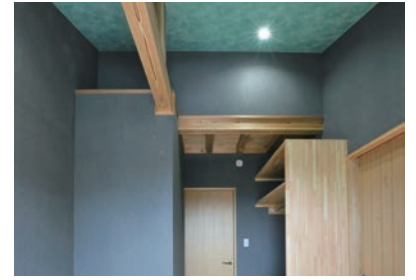
主寝室の壁・天井は音系統のクロス貼り。落ち着いた雰囲気演出。

柱の美しい木目がアクセントになり、とても温かい空間をつくっているO邸の主役はやはり蒔ストロップ。「私が単身赴任で、娘たちが大学に行っていたりと、普段の生活で一緒にいられる時間が少ないので、とにかく人が集まる家になりたいと思っただけです。」とご主人が語るように、和室の小上がりに腰掛け蒔ストロップを眺める。心も温まり、話も弾む。そんな空間に人が集まるようになりました。 さらに、蒔ストロップによって享受される暖房効率の高さは家族間のコミュニケーションを最大化しています。部屋を区切る必要がなくなり、家族で空間を共有、自然と会話が生まれます。「最初は部屋の真ん中に蒔ストロップを置くつもりだったのですが、打ち合わせを進めるうちに、煙突をどうするかなどを考えて少しずつ壁の方へ移動していきました。最終的に部屋の端に落ち着いたのですが、暖気がダクトを通して2階も温めてくれるということなので、寒くなつてからが楽しみです。」とご主人が語ってくれました。全館暖房が可能になる等、蒔ストロップがもたらすメリットはたくさんあります。 またご主人の理想だけでなく、奥様、お嬢様の理想も形になっています。子供部屋はお嬢様の希望を叶え、海をイメージさせるこだわりのクロス貼りに。友達が遊びに来るロフトもお嬢様お気に入りの場所です。一方、キッチン周りはお嬢様の理想が形に。「移動収納できる配膳台や、カウンターの下に収納できる椅子など、色々と希望を叶えていただきました。中でもキッチンの造作は、大工さんが丁寧に仕上げてくださいましたので、本当に嬉しい仕上がります。」と奥様が語ってくれました。 リビングには外にすぐ出ることが可能な縁側があり、こちらも人が集まるスポット。ご家族はもちろん、ご近所の方も集まる場所。O邸はまさに人が集まる理想の住まいになったと思います。