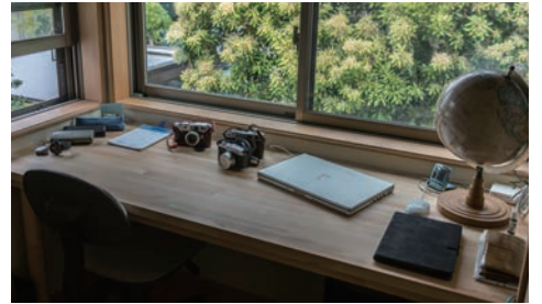
陰影の映える書斎。緑の借景が嬉しい。趣味のフィルムカメラやパイロット必需品のサングラス等が並ぶ。

材を巧に扱っていたのを見て、信頼いただき、このようにご縁をいただくこととなりました。 この度、国際線パイロットのご主人が、交通利便性に優れた東京の高層マンションから逗子への住み替えをされたのは、ご家族、特にお子様の成長を考えたことが大きいとのこと。「海までゆつくり歩いて5分なので、トコトコとビーチまで散歩するのが気持ち良いんですよ」とご主人。自ら養生された自慢の芝生の庭には、お子様が拾ってきた貝殻や木の枝等が散りばめられており、海の近くに住まうメリットを最大限に享受されております。多趣味なご主人がこの逗子の地に来て新たに始められたのはヨット。マリンスポーツに適した場所ならではの趣味がまたご加わりしました。 この家は本当にこだわりの宝庫。採光に優れた風通しも良い大空間のLDKには、異なる木材を組み合わせて仕立てられた木扉や、水滴や流水のようなテクスチャーが楽しいガラス戸、完全オリジナルで創られたヤマザクラ材造作キッチン。そして二階の伸びのびと気持ちの良い勾配天井には、朝の光が差し込むとても美しい広々としたロフト空間、ドイツのホームセンターにて購入されたブランコが主役のお子様の遊び場、趣味の部屋でもある書斎は本棚が印象的でとても落ち着くご主人だけの空間。ただ何といつても、ご主人も奥様もお子様も、皆様がこの家の中で一番好きな場所はやはりウッドデッキのある芝生の庭。「とにかく気持ち良いんですよ」と皆様、口を揃えます。ウッドデッキで日向ぼっこをしながら昼寝をしたり、お子様が庭で走りまわる、その様子を見てほっこりしたり。先日、逗子で花火大会があったときは、パーベキューをしながら夏の風物詩を楽しむ、といった贅を味わったり。住み始めてすぐ自らのライフスタイルにフィットする、そんな家づくりが私たち斎藤工務店のポリシーです。