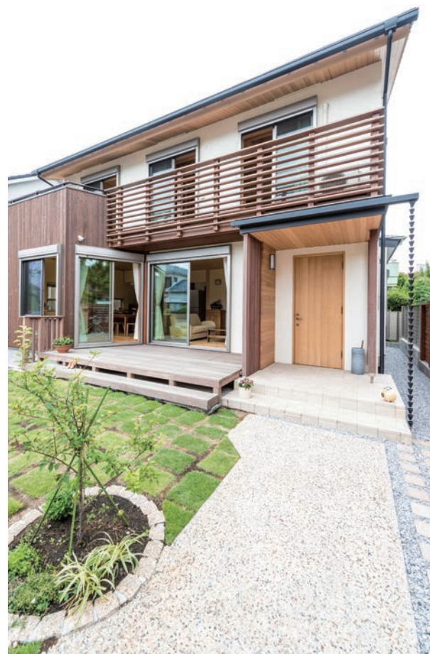
ファサード(外観)の主役である格子がこの家をスタイリッシュに見せる役割を担っている。皆が「とにかく気持ち良い」と口を揃えるウッドデッキのある芝庭は、これからも数々の思い出ができる場所。

2016年3月、この逗子という好立地に完成したZ邸は、建築設計事務所を営まれているご両親が息子夫婦のために設計した家族愛が感じられる暖かいお家。息子であるご主人、そして奥様やお子様の思い描くライフスタイルをすべて実現できる家が完成しました。 実は私たち斎藤工務店がご主人に初めてお会いしたのは契約の数日前。初めて出会ったのも、それまでのお打ち合わせや見積もりのチェックを行ったのもすべてご両親とでした。出会いは、建築設計事務所をされているご両親が工務店を探していた際、当社の鎌倉の新築現場へお立ち寄りいただいたことがきっかけです。ご両親の建築設計事務所では、元より木造在来工法を計画されており、そのために真にプロフェッショナルな大工と真に優れた木材を兼ね備えた工務店を探されておりました。その鎌倉の現場で、当社大工が自慢の紀州材を含めた無垢