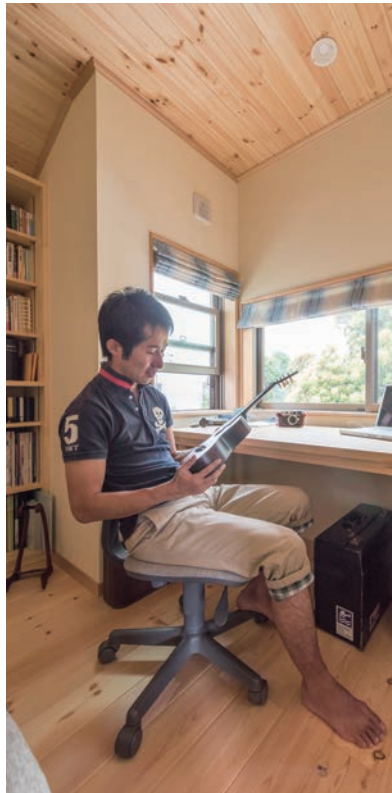
二階の書斎はご主人だけの趣味空間。ウクレレを弾くのも絵になる落ち着いた大人の空間。