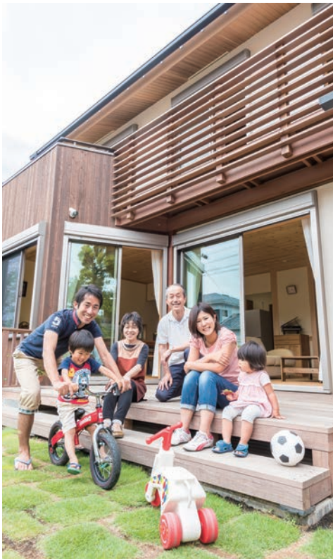
ご主人も奥様もご両親もお子様も、皆が一番好きなウッドデッキのある芝庭。とても暖かく気持ち良く、皆が自然と笑顔になる場所。

材を巧に扱っていたのを見て、信頼いただき、このようにご縁をいただくこととなりました。 この度、国際線パイロットのご主人が、交通利便性に優れた東京の高層マンションから逗子への住み替えをされたのは、ご家族、特にお子様の成長を考えたことが大きいとのこと。「海までゆつくり歩いて5分なので、トコトコとビーチまで散歩するのが気持ち良いんですよ」とご主人。自ら養生された自慢の芝生の庭には、お子様が拾ってきた貝殻や木の枝等が散りばめられており、海の近くに住まうメリットを最大限に享受されております。多趣味なご主人がこの逗子の地に来て新たに始められたのはヨット。マリンスポーツに適した場所ならではの趣味がまたご加わりしました。 この家は本当にこだわりの宝庫。採光に優れた風通しも良い大空間のLDKには、異なる木材を組み合わせて仕立てられた木扉や、水滴や流水のようなテクスチャーが楽しいガラス戸、完全オリジナルで創られたヤマザクラ材造作キッチン。そして二階の伸びのびと気持ちの良い勾配天井には、朝の光が差し込むとても美しい広々としたロフト空間、ドイツのホームセンターにて購入されたブランコが主役のお子様の遊び場、趣味の部屋でもある書斎は本棚が印象的でとても落ち着くご主人だけの空間。ただ何といつても、ご主人も奥様もお子様も、皆様がこの家の中で一番好きな場所はやはりウッドデッキのある芝生の庭。「とにかく気持ち良いんですよ」と皆様、口を揃えます。ウッドデッキで日向ぼっこをしながら昼寝をしたり、お子様が庭で走りまわる、その様子を見てほっこりしたり。先日、逗子で花火大会があったときは、パーベキューをしながら夏の風物詩を楽しむ、といった贅を味わったり。住み始めてすぐ自らのライフスタイルにフィットする、そんな家づくりが私たち斎藤工務店のポリシーです。