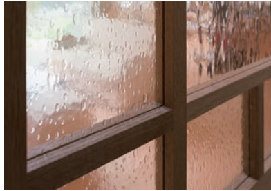
水滴や流水のようなテクスチャーが楽しいガラス戸。この家にはこの他にも細部にこだわりが多々感じられる。