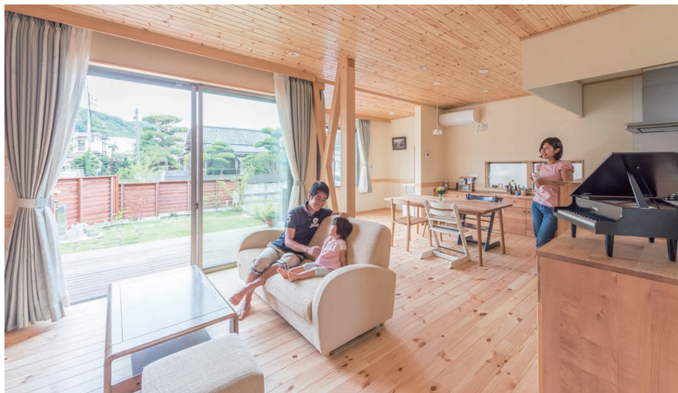
採光に優れ、風通しも良い大空間のLDKは、ウッドデッキやその先の芝庭と相まって、これ以上ない開放感を生み出している。