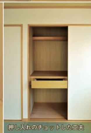
押し入れのチョットした工夫