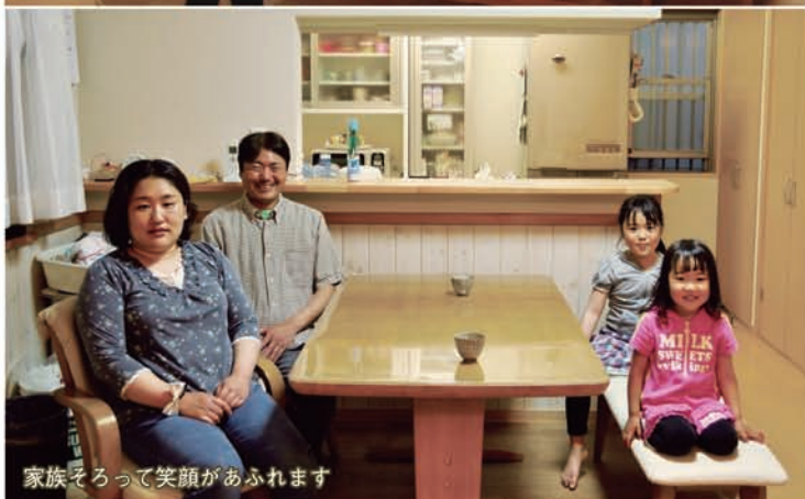
家族そろって笑顔があふれます