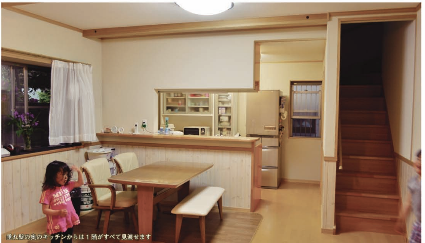
垂れ壁の奥のキッチンからは1階がすべて見渡せます