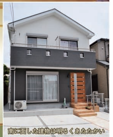
南に面した建物は明るくあたたかい