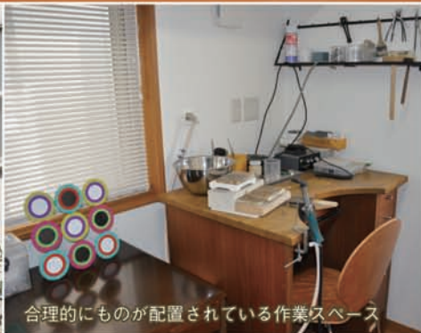
合理的にもものが配置されている作業スペース