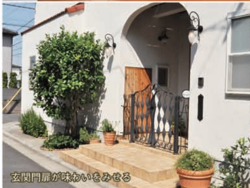
玄関門扉が味わいをみせる