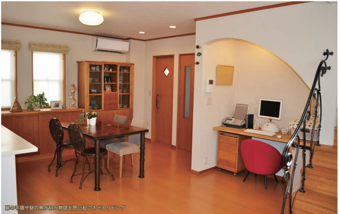
扉の手摺や壁の魚が何か物語を思い起こさせるリビング